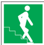
SMJER KRETANJA STUBAMA - DOLJE DESNO