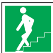
SMJER KRETANJA STUBAMA - DOLJE LIJEVO